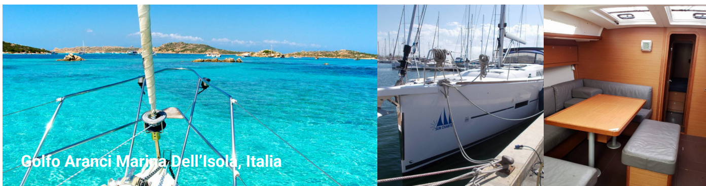
Golfo Aranci Marina Dell'Isola, Italia