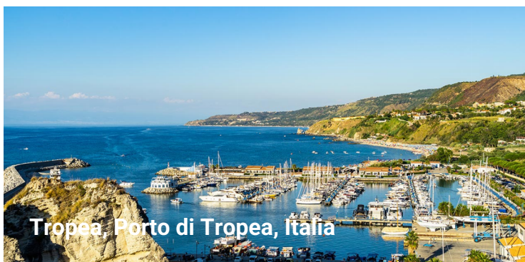
Tropea Porto di Tropea, Italia