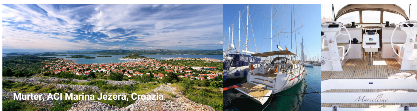
Murter, ACI Marina Jezera, Croazia