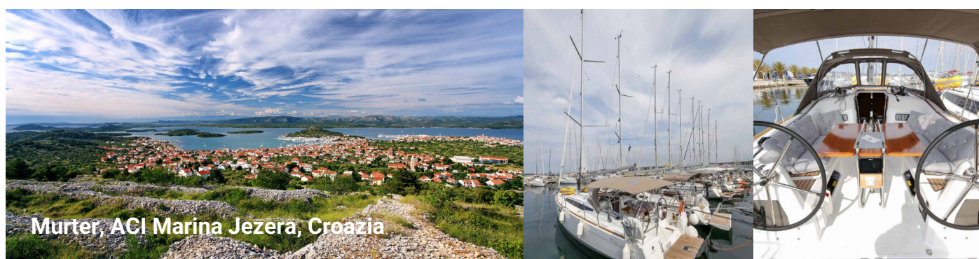
Murter, ACI Marina Jezera, Croazia