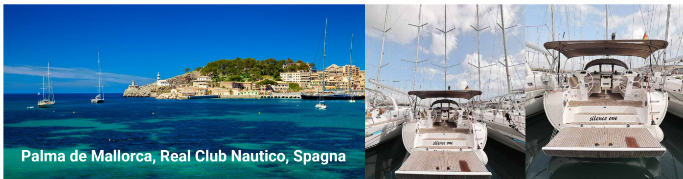
Palma de Mallorca, Real Club Nautico, Spagna