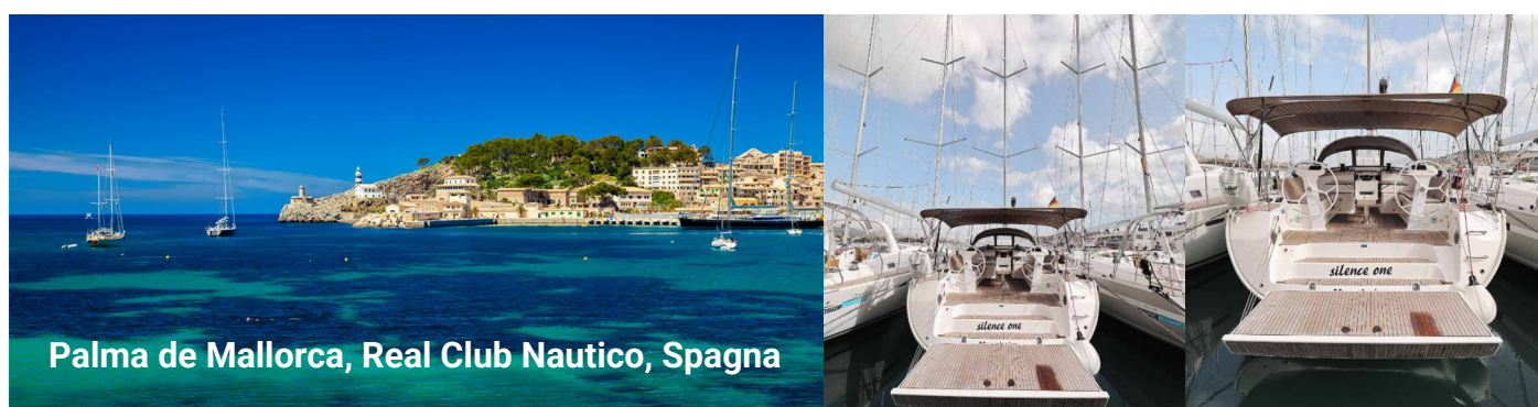
Palma de Mallorca, Real Club Nautico, Spagna